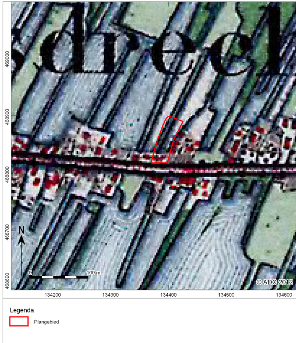
Afb. 5 Locatie van het plangebied op de Bonnekaart uit 1877