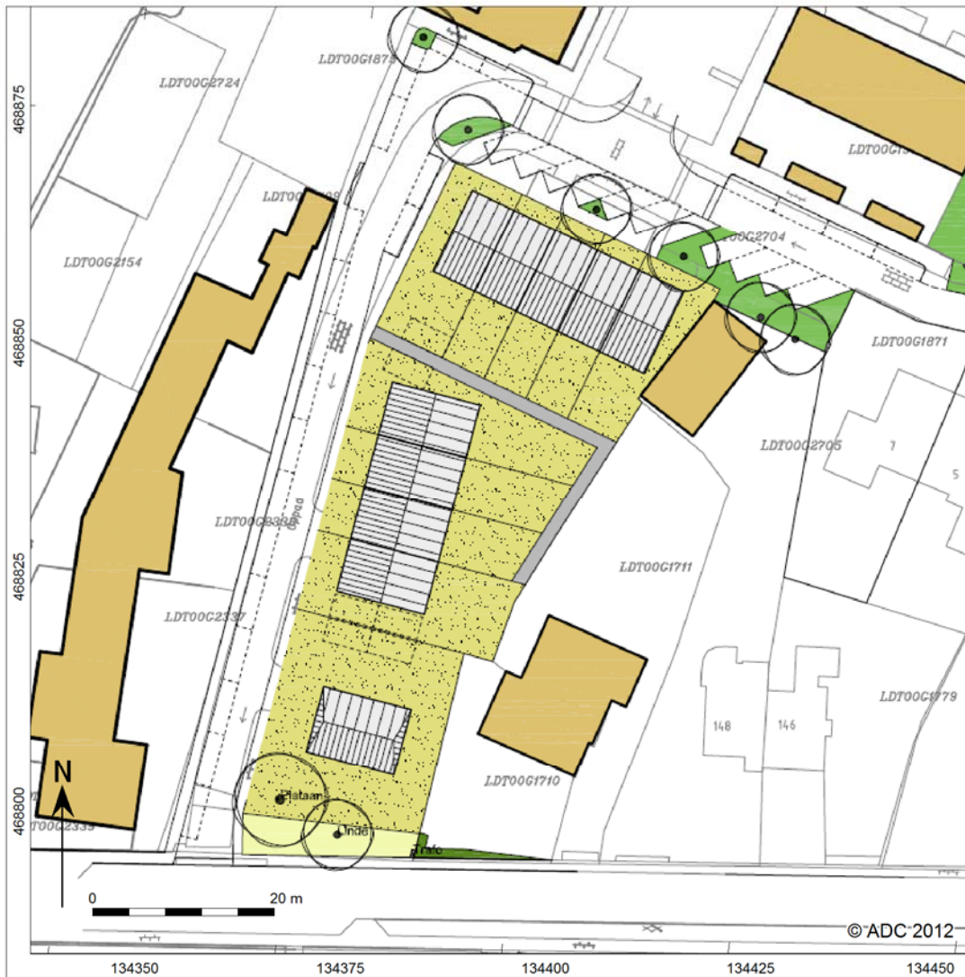
Afb. 3 Bouwplannen