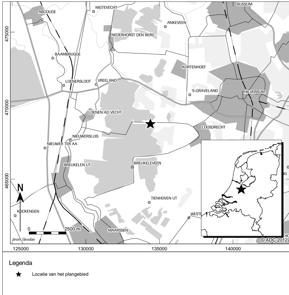
Afb. 1 Locatie van het plangebied