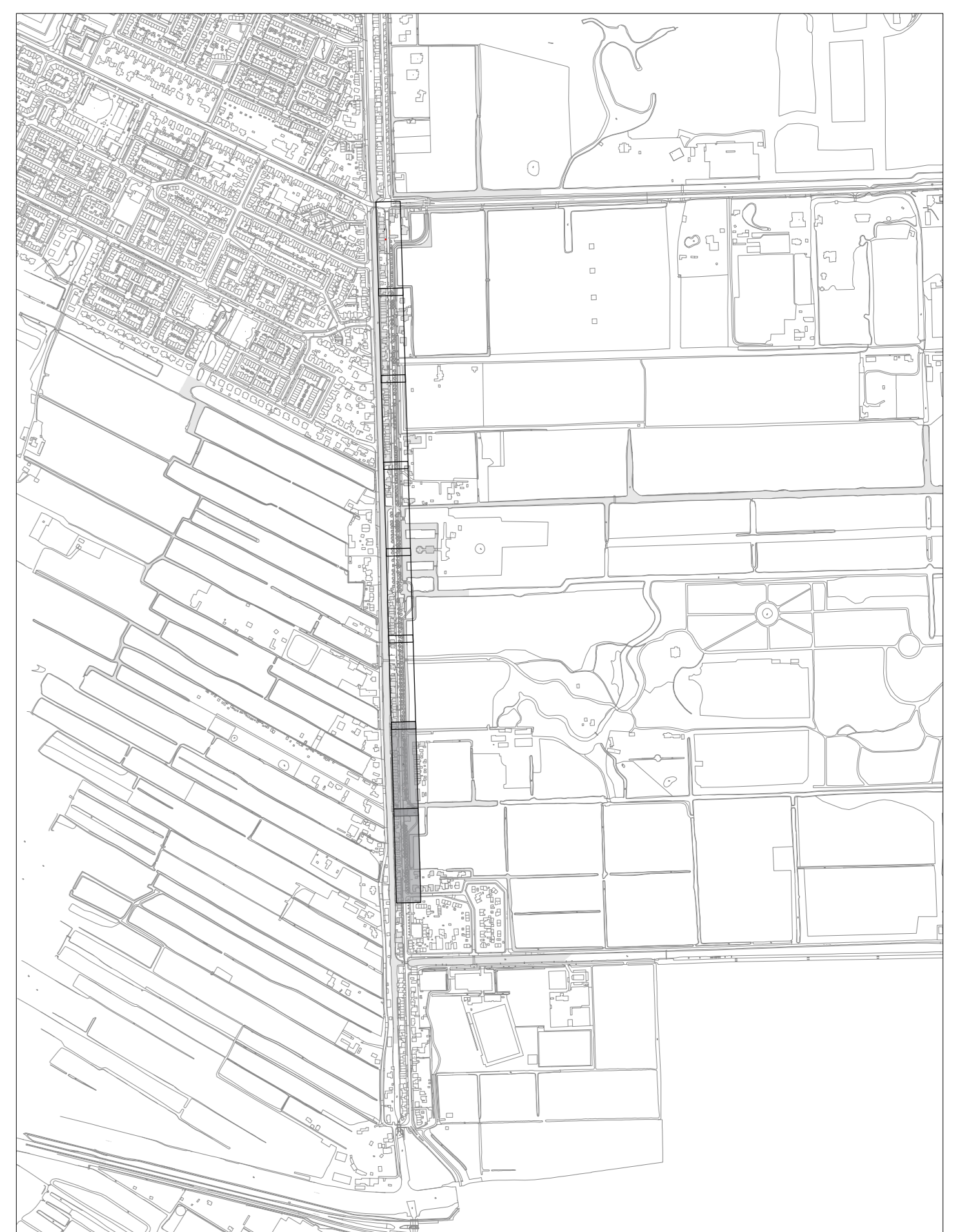
TOTAALOVERZICHT Schaal 1:10.000