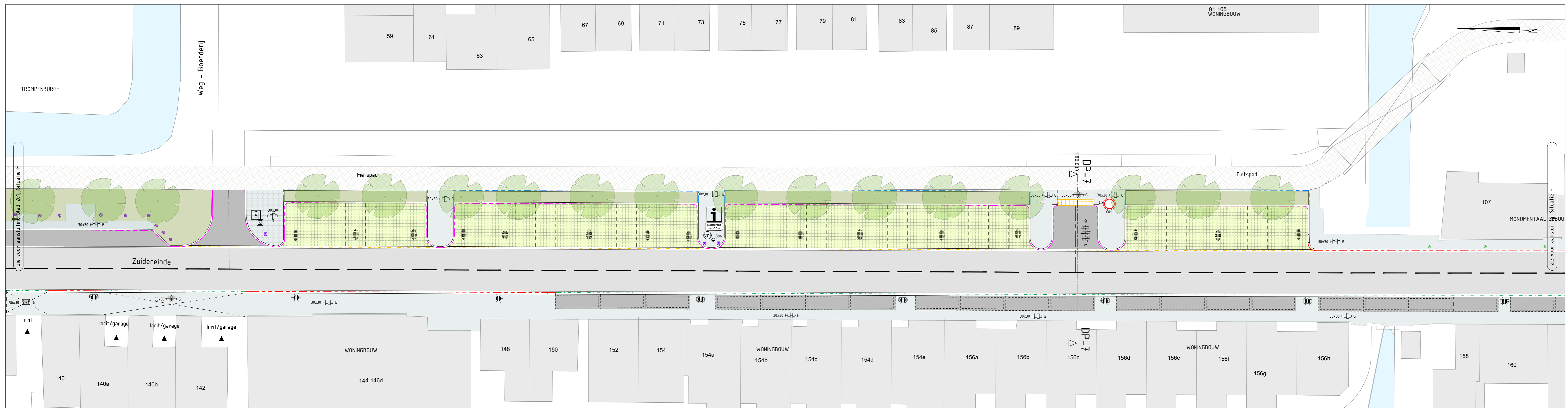
SITUATIE G Schaal 1:200