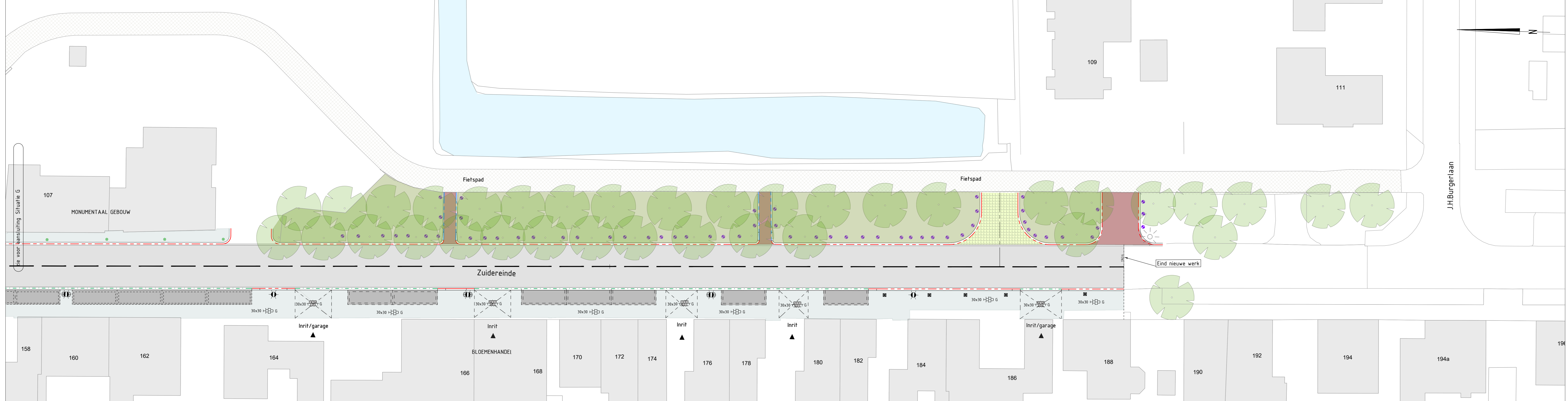
SITUATIE H Schaal 1:200