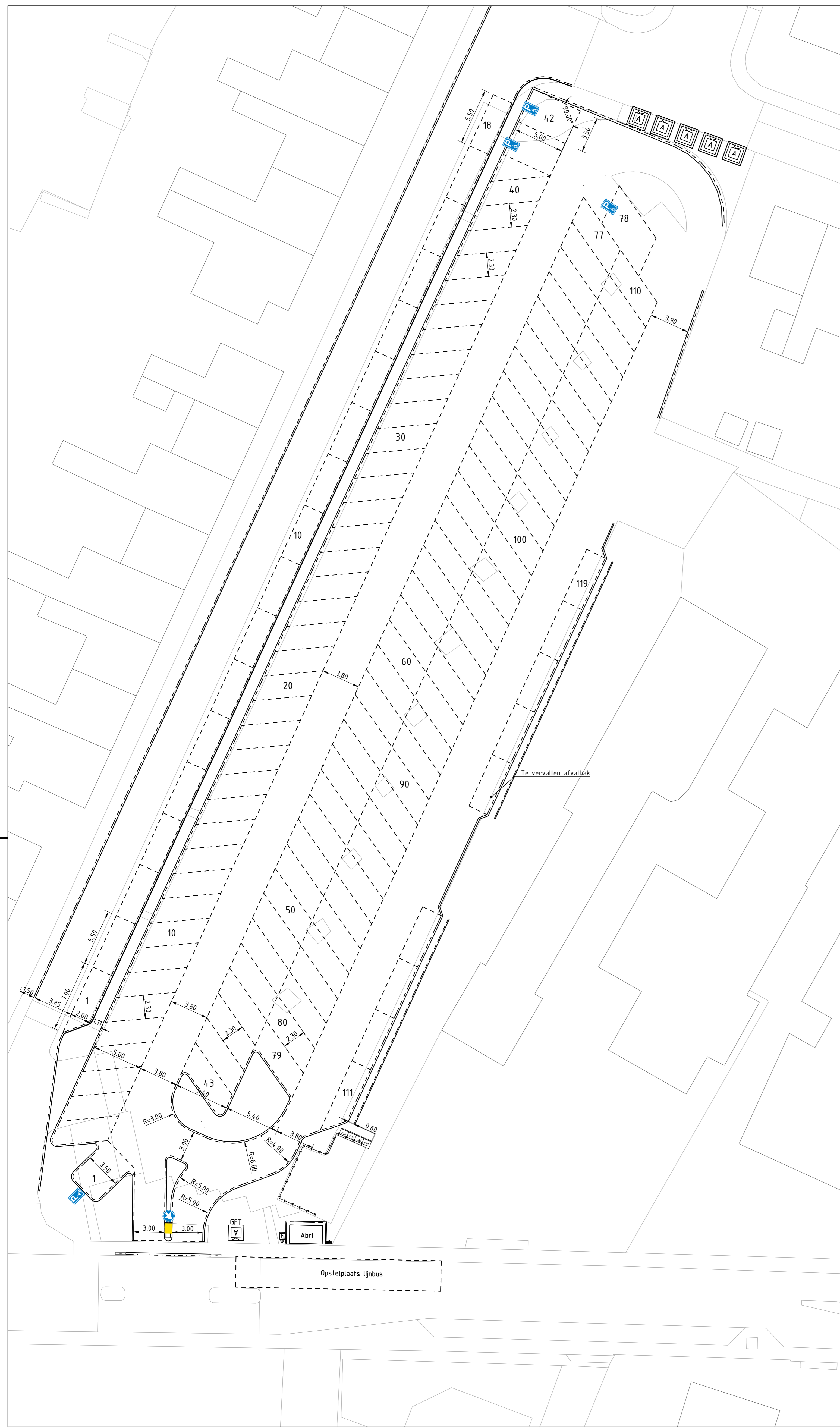
Variant met behoud van groenstrook en bomen aan de oostzijde