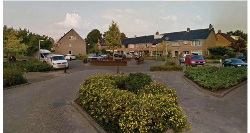
Plein Van Breelaan, gezien vanaf de zuidzijde