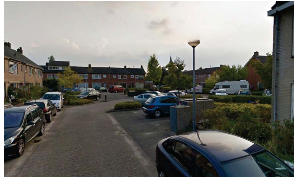
Plein Van Breelaan, gezien vanaf de noordzijde