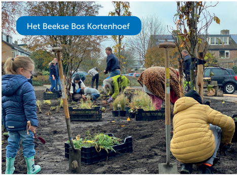
Het Beekse Bos Kortenhoef