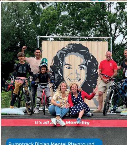
Pumptrack Bibian Mentel Playground Nieuw-Loosdrecht