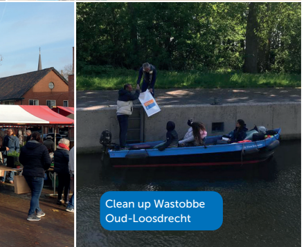
Clean up Wastobbe Oud-Loosdrecht