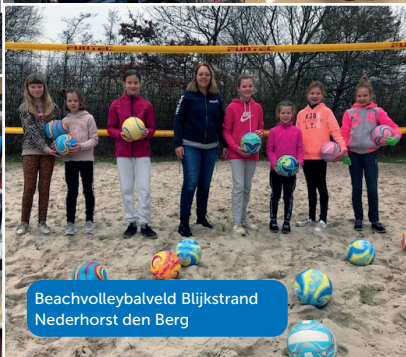
Beachvolleybalveld Blijstrand Nederhorst den Berg