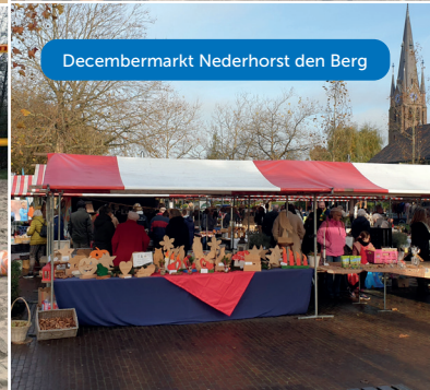
Decembermarkt Nederhorst den Berg