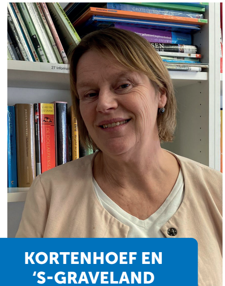
KORTENHOEF EN 'S-GRAVELAND

We kunnen iedere dinsdag open van 13.00 tot 17.00 en vrijdag van 15.00 tot 17.00 uur op een mooie locatie aan de Dodaarslaan 16.