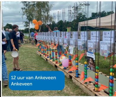
12 uur van Ankeveen Ankeveen