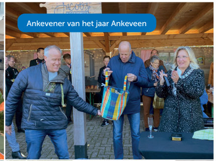
Ankeveener van het jaar Ankeveen