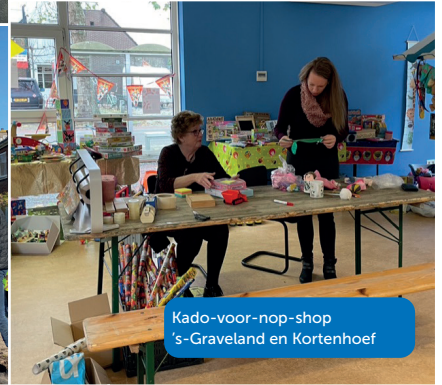
Kado-voor-nop-shop 's-Graveland en Kortenhoef