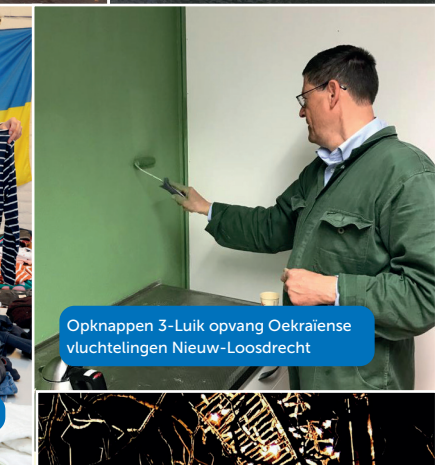
Opknappen 3-Luik opvang Oekraïense vluchtelingen Nieuw-Loosdrecht