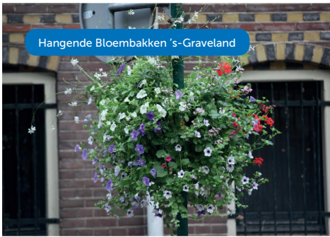
Hangende Bloembakken 's-Graveland

Wilt u in contact komen met het dorpenteam? Kijk dan op www.wijdemeren.nl/dorpenbeleid