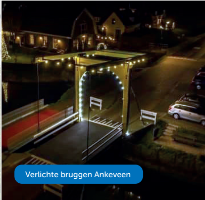
Verlichte bruggen Ankeveen