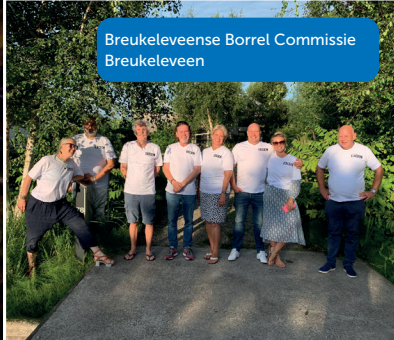
Breukeleveense Borrel Commissie Breukeleveen