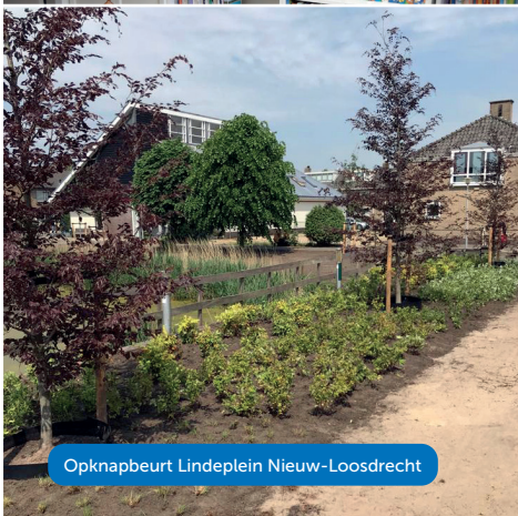
Opknappbeurt Lindeplein Nieuw-Loosdrecht