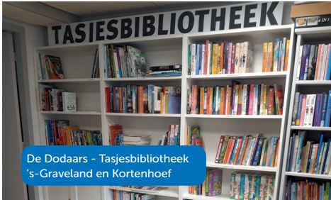
De Dodaars - Tasjesbibliotheek 's-Graveland en Kortenhoef