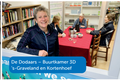
De Dodaars – Buurtkamer 3D 's-Graveland en Kortenhoef