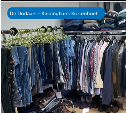
De Dodaars - Kledingbank Kortenhoef