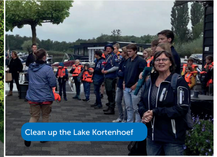
Clean up the Lake Kortenhoef