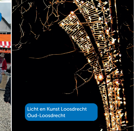
Licht en Kunst Loosdrecht Oud-Loosdrecht