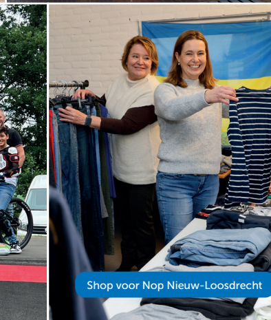
Shop voor Nop Nieuw-Loosdrecht