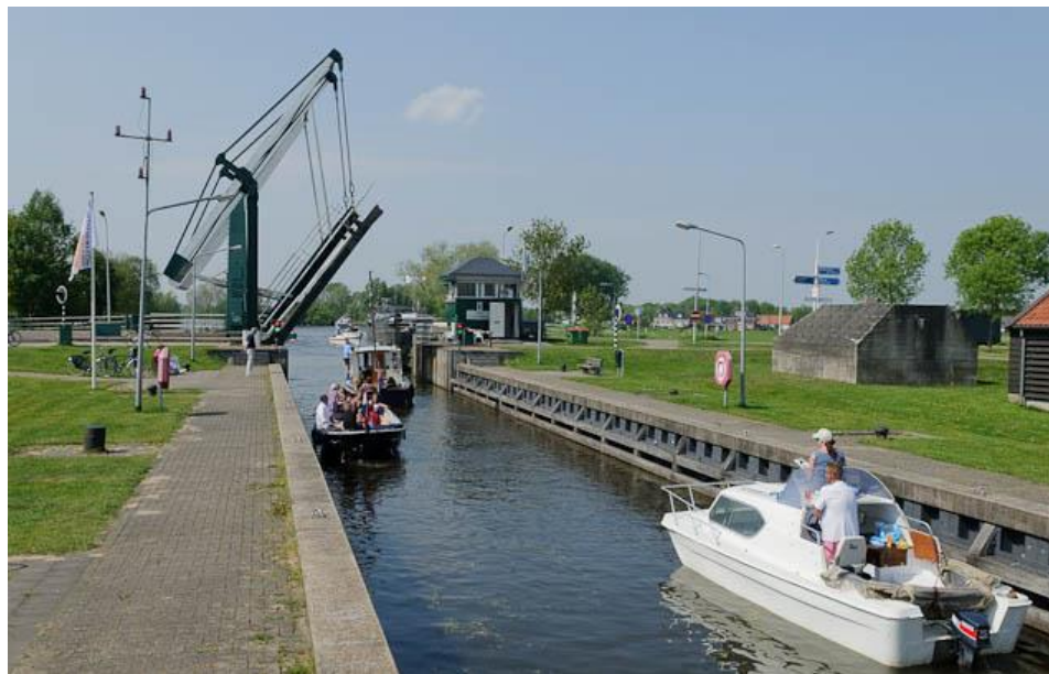
Sluis 't Hemeltje: toegang tot het Hilversums Kanaal en de Loosdrechtse Plassen

Dezelfde mogelijkheid is er ook bij het herindelingsadvies, waarbij de gemeenteraad uitwerkingsopdrachten geven. Ten slotte is er in 2025 en 2026 nog alle ruimte voor gemeenteraden om inhoudelijke of financiële besluiten te nemen gericht op een goede start van de gemeente per 1 januari 2027.